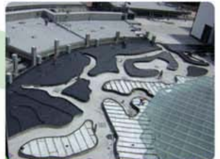
HOSPITAL DE ESPECIALIDADES DURANGO