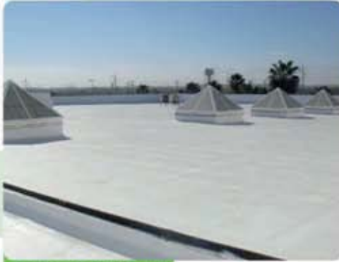
COOPER LIGHTING, MTY.