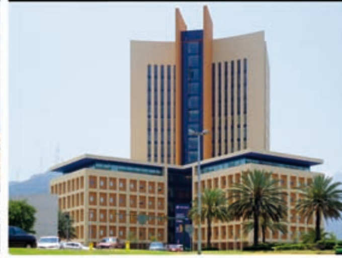
HOSPITAL ZAMBRANO MONTERREY