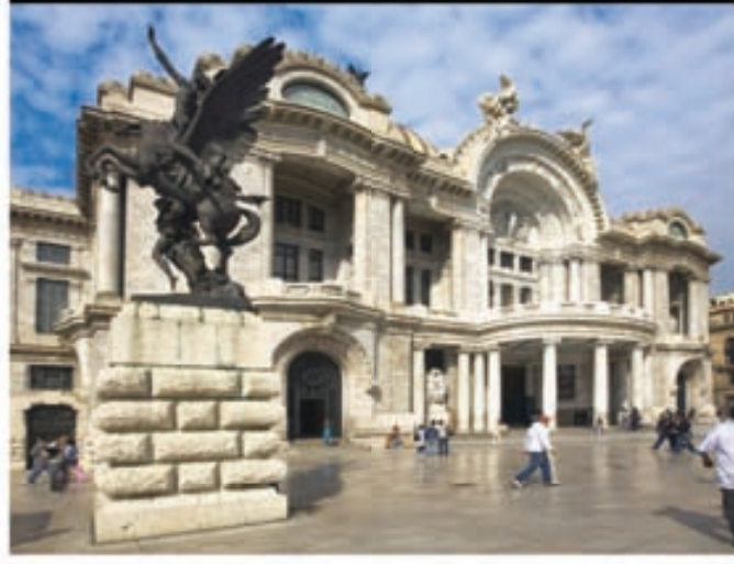
PALACIO DE BELLAS ARTES