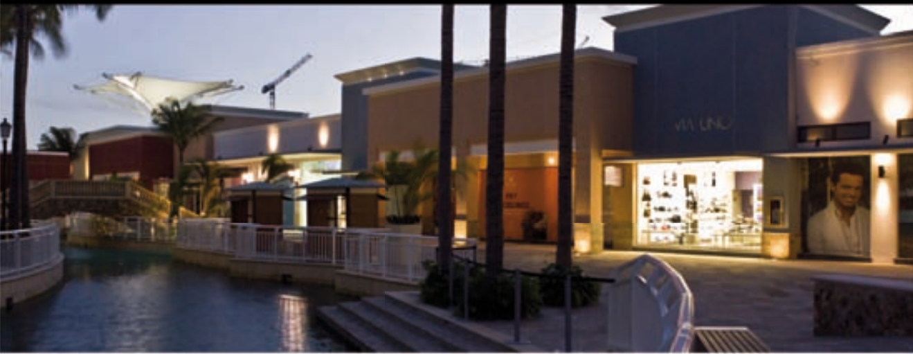
LA ISLA ACAPULCO